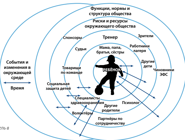
Рисунок 1. Экологично-структурная модель в контексте футбола