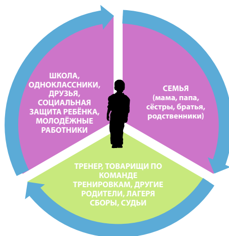
Рисунок 2. Сеть ближайших контактов ребёнка в футбольном контексте

Вышеуказанная модель пытается дать более широкий обзор о тех сферах (уровнях), которые окружают ребёнка, и о тех факторах/лицах влияния, которые в эти сферы входят. Если сузить этот круг, то сеть ближайших контактов ребёнка в футбольном контексте представляет собой его семью, людей, свя-