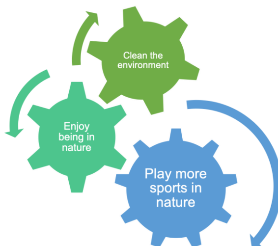
Joonis 1: puhtama keskkonna ja suurema looduses toimuma sportimise ringmõju

Üldiselt ja nagu ka intervjuudest välja tuli, saab keskkonnakaitset kasutada stiimulina enamaks sportimiseks. Kaks juhtumit näitavad kahte võimalikku teed: